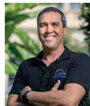
Direction : Mr Patrick BERTRAND

Située aux confins de l'Italie et de la Principauté de Monaco, au pied des montagnes tombant dans la mer, Menton est l'un des joyaux de la Côte d'Azur. Depuis les corniches qui surplombent la ville, on peut admirer un paysage de carte postale, celui d'une cité posée sur la mer et baignée d'un chaud soleil, et ceci toute l'année. Décoration raffinée, soulignée par l'empreinte de son passé prestigieux, l'Hôtel El Paradiso, vous séduira par sa vue sur la Méditerranée et ses soirées animées.